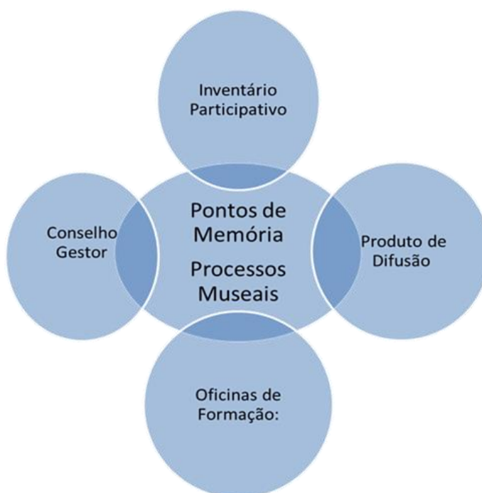
Esquema 1 Estrutura Metodológica Programa Pontos de Memória:

em recolher depoimentos e acervos para um banco de informações sobre a região. Por meio de iniciativas de memória, entrevistas, encontros, chás, rodas de conversas, feiras, os grupos obtêm informações a partir das histórias de cada localidade, além de todas as manifestações possíveis de serem recolhidas desde as experiências da comunidade. Na medida em que este trabalho se concretizava, era preciso divulgá-lo para alcançar mais moradores, mais parceiros, noticiando a experiência vivida e ampliando a capacidade de atrair mais interessados em manter viva as memórias e as histórias colaborando para o fortalecimento do Ponto e dos processos museais ali desenvolvidos.