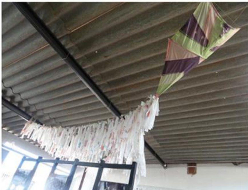
Imagem19: Pipa confeccionada pela comunidade em exposição na Casa dos Movimentos.

A Exposição Movimentos da Estrutural - Luta, Resistência e Conquistas – inaugurada em 21 de maio de 2011, retratou a história de luta do povo da Estrutural – DF, uma área nobre do Distrito Federal, ao lado do Parque Nacional de Brasília e a poucos quilômetros do Palácio do Planalto. A mostra fez um recorte da imensa labuta que foi conquistar a Estrutural, marcado por lutas que custaram vidas e saúde de muita gente, mas que também geraram muitas conquistas, que fazem hoje da Estrutural um lugar vivo. Há muitas outras imagens, muitas outras lutas que ainda não foram representadas, mas a exposição marcou o início e o incentivo para que o povo da Estrutural, tão guerreiro, continue a contar sua história (NOLETO, 2013. p. 10).