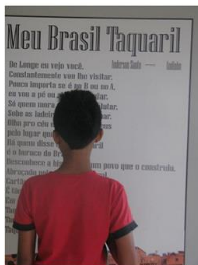
Imagem: 35 À esq., visitantes observam uma instalação da exposição. À direita, painel com a letra da canção.

Diante das experiências apresentadas, que representam parte e não o todo das realizações destas iniciativas, não seria possível listar todas as ações propostas, pois cada