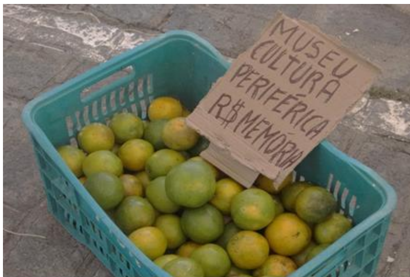
Imagem: 30 Exposição itinerante “Memórias que o vento não levou”. Fonte: Produto 07/2012. Consultora: Lavínia Cavalcanti. Foto: Adriano Almeida /2012

Ao optar por realizar a exposição na “Feirinha do Jacintinho” o Ponto de Memória, visou aprofundar as relações com os moradores, expondo suas memórias coletivamente construídas. Por ser um espaço aberto de muita presença e visibilidade local, a atenção para os temas de interesse do museu seria mais facilmente atraída. As imagens acima demonstram que com criatividade e entusiasmo os resultados são ampliados e fazem diferença para a conquista do diálogo acerca do museu, da memória individual e a coletiva que somadas constituem o território museal. A equipe do Museu da Cultura Periférica passava a ser naquele momento “Feirantes da Memória” Importante ressaltar que a exposição foi lançada seguida por mais duas grandes atividades que contribuíram para mobilizar ainda o bairro e diversificar e ampliar ainda mais o alcance de outros públicos, como os jovens e as crianças. Além da feira foi também utilizado o espaço da Escola Estadual Simplício, para uma palestra com a Professora Elizabeth Salgado. O Projeto Mirante Cultural: um quilombo chamado Jacintinho, em sua trigésima edição comemorou o mês da consciência negra, em uma noite de festa que teve como principal objetivo celebrar e discutir a memória do Jacintinho. (IBRAM, 2015: 33)