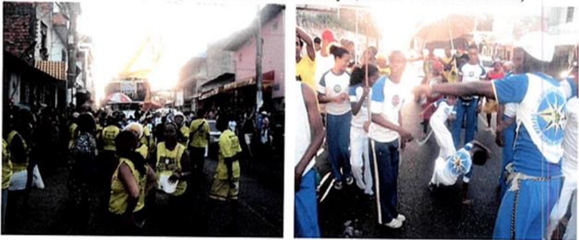
Imagem: 32 Marcha do Beiru. In: Produto (SILVA, 2012:15).

descendentes; da UNEB – Universidade do Estado da Bahia e das esferas governamentais em âmbito do Municipal, Estadual e Federal. (SILVA, 2012:15)