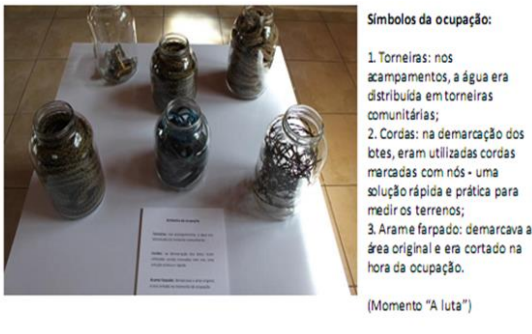
Imagem 23: Objetos expostos na Exposição “Memórias e Sonhos do Sítio Cercado” e legenda de Lavínia Cavalcanti.

Ao finalizar o produto destinado ao IBRAM com os resultados obtidos a partir do processo de realização do Produto de Difusão em cumprimento as exigências metodológicas, o consultor local Marcelo Rocha nos brinda com a seguinte declaração