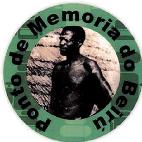
Imagem 5: Símbolo do Ponto de Memória do Beiru.