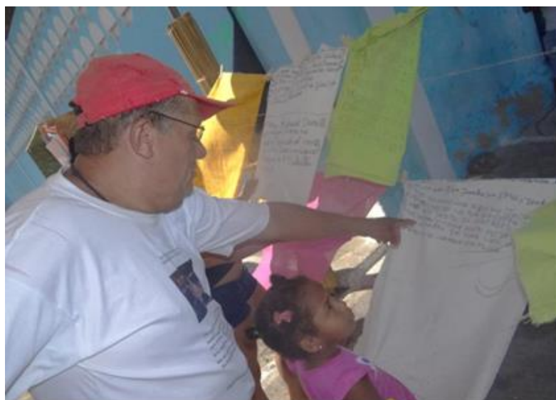
Imagem: 29 Exposição itinerante “Memórias que o vento não levou”. Fonte: Produto 07/2012. Consultora: Lavínia Cavalcanti. Foto: Adriano Almeida /2012

Parte do acervo exposto durante a realização da exposição, tem origem nos “Fragmentos dos relatos recolhidos na pesquisa de história oral do inventário participativo foram transcritos sobre tecidos, e pendurados no varal da exposição montada na feira de Jacintinho” Como podemos observar na imagem acima (CAVALCANTI, 2012: 27).