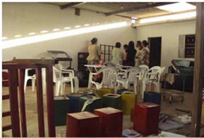
Imagem 20: Oficina Prática de Montagem da Exposição Movimentos da Estrutural: Luta, Resistência e Conquistas – Março a maio de 2011

Os processos de aprendizagem que surgem desta experiência podem ser sentidos no desenvolvimento e amadurecimento do Ponto que em: