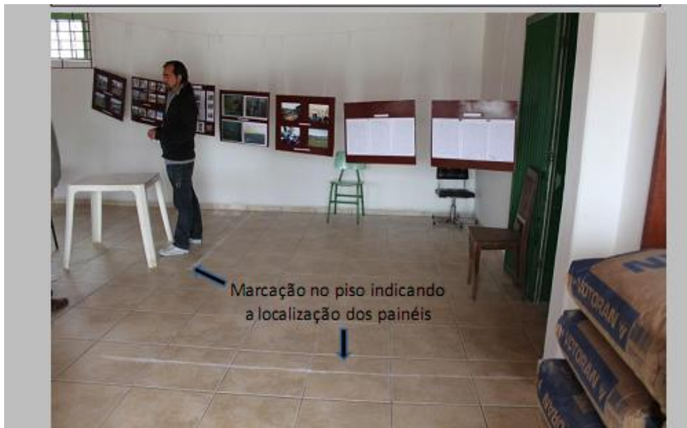
Imagem 22: Oficina de Expografia. Marcelo Vieira.