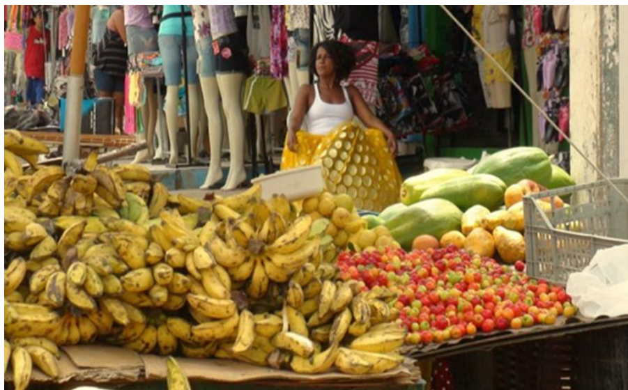
Imagem: 6 Feirinha do Jacintinho. Foto de Jorge Schutze/ 2011. (In: RODRIGUES, 2013)

A identidade do bairro e ligada à feirinha... Não tem para onde correr... Ela é o coração do Jaça, bate a semana inteira... De domingo a domingo... Pessoas do bairro consomem no próprio bairro... A feirinha é um espaço que a gente encontra de tudo... É nossa referência... O ganha pão de muita gente... (Viviane Rodrigues) 104