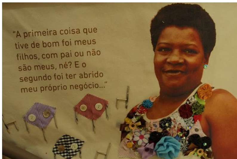
Imagem: 02. Exposição Mulheres Guerreiras do Museu de Favela

A fala da mulher guerreira da Comunidade do Pavão Pavãozinho e Cantagalo território do Museu de Favela, nos inspira a conhecer melhor esta iniciativa que, entre tantas ações, destaca suas mulheres e as reconhece pelas lutas e batalhas em sua região. Suas vidas são alvo de uma campanha em prol das memórias de todas as batalhadoras que lutam por dias melhores e mais dignidade para si próprias e para os seus filhos e parentes. Donas das casas e dos seus destinos, fortalecem a todos com a coragem de quem acorda todos os dias para batalhar dias mais justos e cheios de afeto. Assim como as Mulheres Guerreiras, os jovens também tem vez no MUF: