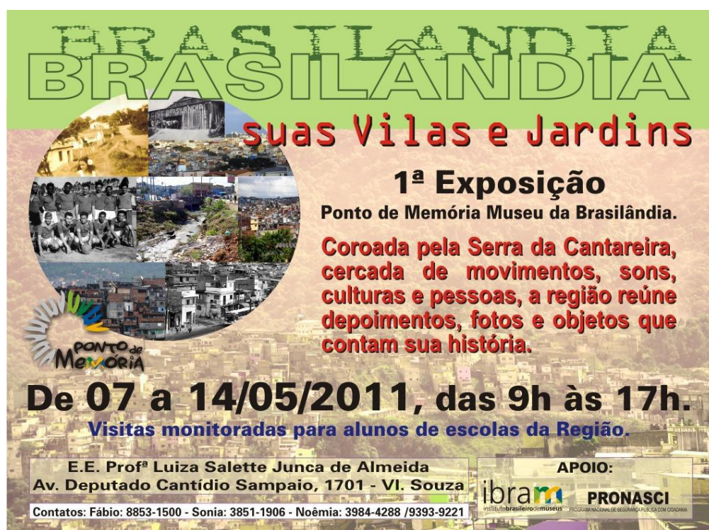
Imagem: 13 Poster da exposição do Ponto de Memória da Brasilândia Fonte: Produto Lavínia Cavalcanti 127

Brasilândia está situada na cidade de São Paulo, maior metrópole do país com 10.400.000 habitantes, com 455 anos. Seus habitantes estão inseridos dentro do distrito Freguesia do Ó-Brasilândia, aonde a Freguesia do Ó tem 451 anos e a Brasilândia com 62 anos e 276 mil habitantes. Esses dados são retirados do depoimento de Fábio que explica que Brasilândia tem movimentos sociais extremamente fortes, que atendem mais de 20 mil pessoas. Para este militante o Ponto de Memória, será mais uma das tantas iniciativas