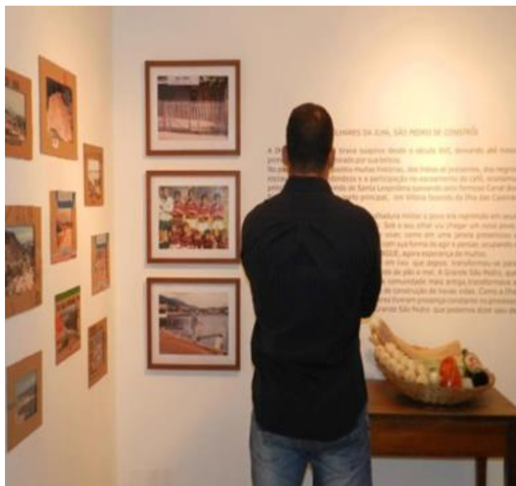
Imagem: 33 Lançamento da exposição no Museu do Pescador "Manoel dos Passos Lyrio" Foto: Claudete O. Bispo - Out./2012. In: (GERVÁSIO, 2013)