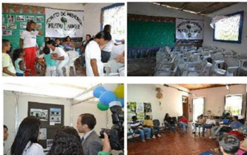
Imagens: 31 Exposição Museu Mangue do Coque.