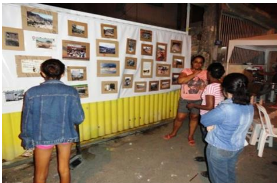
Imagem: 34 Exposição e exibição de vídeos- Bairro Resistência - 03 e 04/08/2013 In: (GERVÁSIO, 2013)

O vídeo produzido pelo Ponto de Memória tem como título " Ponto de Memória da Grande São Pedro - Inventário Participativo ", resultado das ações de Inventário Participativo realizado na comunidade, segundo o consultor local: