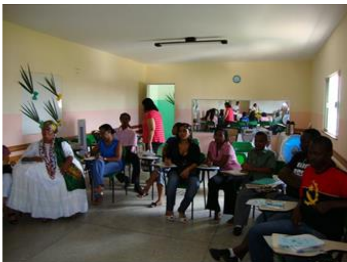
Imagem 4: Reunião de Moradores do Beiru, para apresentação da proposta do Museu do Beiru. Foto: Produto. SCHUABB, 2010.

É preciso resgatar a memória de nossa história afro-brasileira. Não podemos deixar que o nome de um dos primeiros donos das terras seja trocado por Tancredo Neves. Em nossa comunidade há pessoas de outros estados da Bahia, há poucos nativos. E o povo chega e fala que mora em Tancredo Neves porque acha o nome bonito. (SCHUABB, 2010. p. 23)