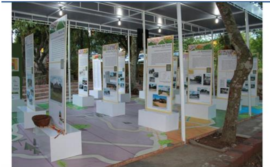
Imagem 24: Exposição Museu Comunitário da Lomba do Pinheiro.

Tanto para o MUF quanto para o Museu do Lomba, os recursos, metodologias, possibilidade de integração e articulação em âmbito nacional por meio do IBRAM, tornaram a experiência do Programa bastante oportuna. Quando da escolha pelas localidades este aspecto foi levado em consideração pela equipe, ou seja, a existência de iniciativas já consolidadas no território potencializaria as ações do programa, ampliando o alcance e a consolidação de tais iniciativas. Creio que intercâmbio entre a experiência poderia ter sido mais intensificado e composto mesmo a metodologia do programa. Além destas duas experiências, Terra Firme e Estrutural, acabaram se beneficiando das parcerias já consolidada com a Universidade e outros Museus o que permitiu avanços mais concretos por parte destas experiências e a permanência das ações mais regulares.