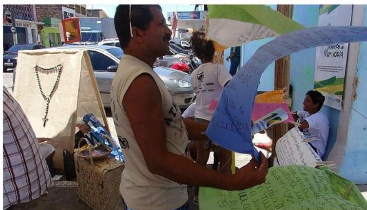
Imagem: 28 Exposição itinerante “Memórias que o vento não levou”. Fonte: Produto 07/2012. Consultora: Lavínia Cavalcanti.

Parte do acervo exposto durante a realização da exposição, tem origem nos “Fragmentos dos relatos recolhidos na pesquisa de história oral do inventário participativo foram transcritos sobre tecidos, e pendurados no varal da exposição montada na feira de Jacintinho” Como podemos observar na imagem acima (CAVALCANTI, 2012: 27).