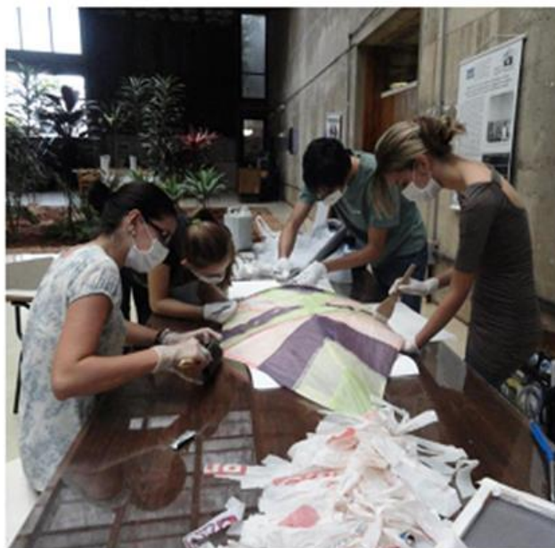
Imagem 21: Pipa em processo de Higienização.

As articulações decorrentes da inauguração da exposição: Luta, Resistência e Conquistas e da repercussão do processo para os integrantes, para a comunidade, fortaleceu laços com Instituições interessadas em promover o diálogo e a curiosidade acadêmica com a proposta, como foi o caso do curso de museologia da UNB. Entre outras parcerias desenvolvidas pelo Ponto, esta talvez tenha sido a que mais ampliou a percepção museal do território. Tanto para os integrantes do Ponto quanto para os alunos e professores do curso. A esse respeito uma das imagens que mais simbolizam o enraizamento da proposta para o campo da museologia é a ação descrita pelos integrantes do Ponto como “pipa em processo de higienização” e faz parte do acervo da UNB: